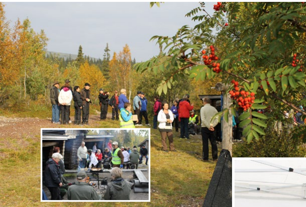
Nokipannukahvit maistuivat upeassa maisemassa.