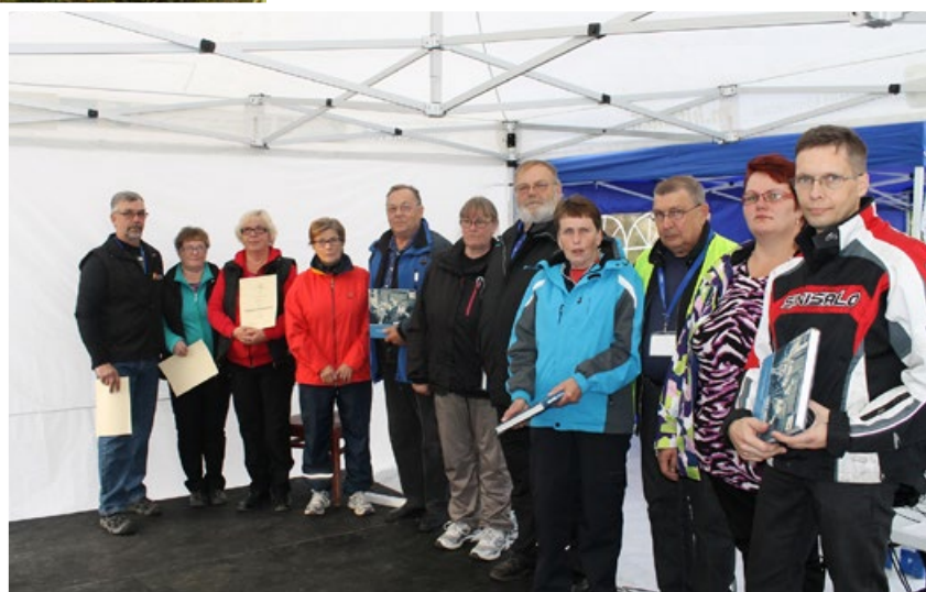
30 v juhlassa palkitut yhdistyksen aktiivitoimijat