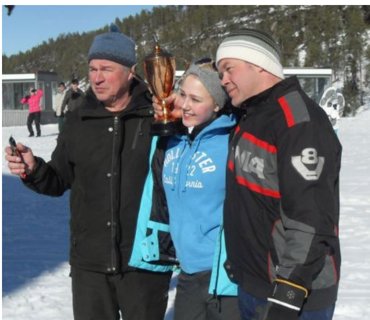
Mononheittokiisan voittajat Matkailuautoilijat.