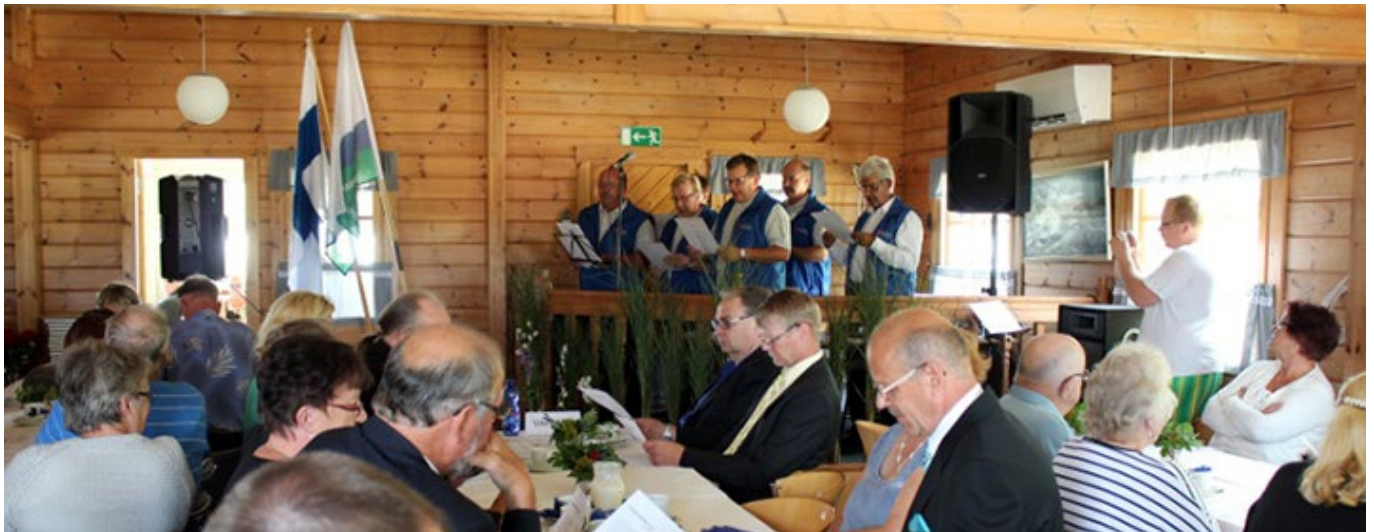
Lohenpyrstön laulun kantaesitys.