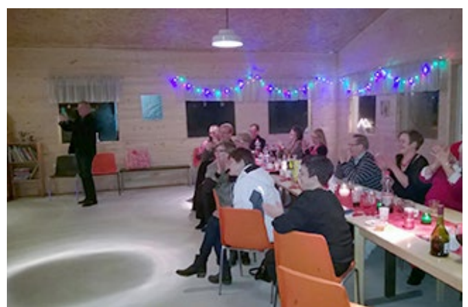
Ohjelmaa seurattiin innostuneena.