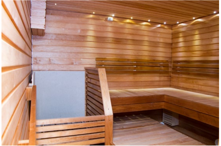
Lauteet rakennettiin tervalepystä ja lämpökäsitellystä haapa-puusta.

Remontti aloitettiin purkamalla vanhat paneelit ja heti tuli ensimmäinen takaisku: tiskihuoneen ja saunan välinen hirsiseinä oli osittain lahonnut. Seinää ei voitu purkaa talvella, joten korjauksena muurattiin harkoista uusi seinä ja hirsiseinä joudutaan myöhemmin korjaamaan tiskihuoneen puolelta. Lattialaatat vaihdettiin myös ja samalla lisättiin lattialämmityskaapelit, aiemminhan saunassa ei ollut lattialämmitystä lainkaan. Myös kiuas