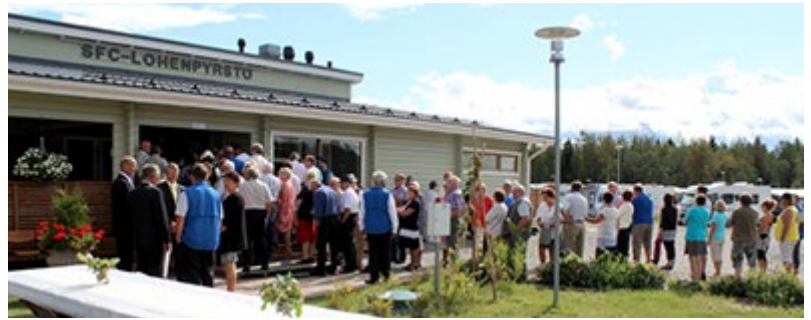
Vihkiäistilaisuuteen saapui runsaasti väkeä.