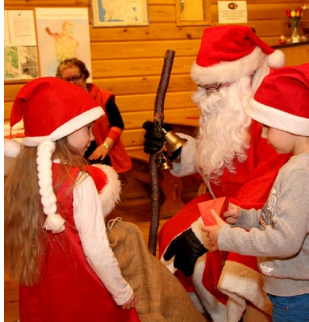
Pikkujoulu ovat niin lasten kuin aikuistenkin juhlaa.