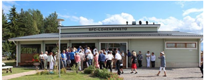
Lohenpirtti ja juhlakansaa.