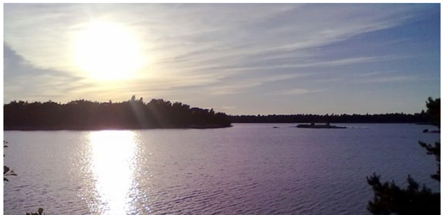
Kaunista Saimaan vesistömaisemaa illankuhjassa.

Turusta ajettiin Forssan SF-alueelle. Siellä tavattiin vanhempi pariskunta, jotka oli joka kesä ajellut Saksasta Suomeen jo kymmeniä vuosia. Rouva oli suomalainen ja hänen miehensä saksalainen. Heidän kanssaan oli mukavia tarinatuokioita iltanuotiolle, mitä kaikkea reissujen varrella oli sattunut ja tapahtunut. Uimapaikka oli vaatimatonta. Se sijaitsi pienen joen/puron varrella ja se oli keskellä tiheää metsää. Itse alue oli iso ruohokenttä. Vaikka uimapaikka ei saanut täysiä