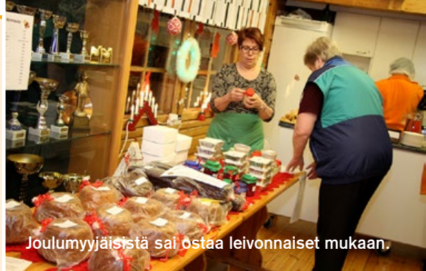
Joulumyyjäisistä sai ostaa leivonnaiset mukaan.