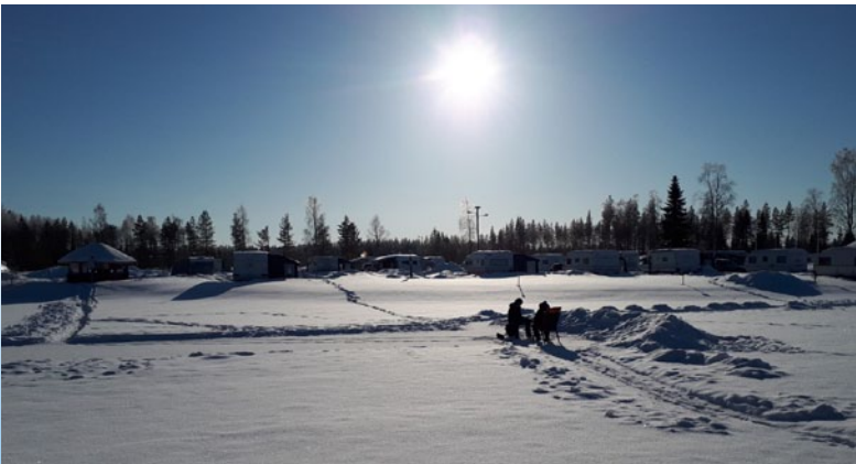
Pakkastapahtuma 2018. Pilkkijät nauttivat auringonpaisteesta lamella.