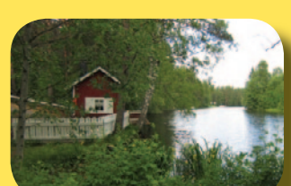
VANKKURIMÄNNIKKÖ www.vankkurimannikko.fi 300 sähköistettyä leirintäpaikkaa. Lakarintie 580, 34800 VIRRRAT Puh. 043 214 0014