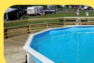
TILKUNPELTO www.sfc-kantahame.com 150 leirintäpaikkaa, kaikki sähköllä. Vaunusauna, uima-altaat ja tanssilato Teurojärven rannalla. Mulkolantie 330, 16900 LAMMI puh. 050 370 1435