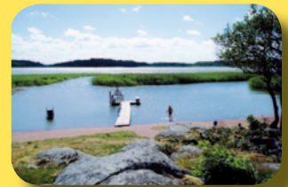
KESÄNIEMI www.sfc-turku.fi 120 leirintäpaikkaa, kaikki sähköllä Kesäniementie 99, Rautila, 23210 VEHMAA. Puh. (02) 433 3462