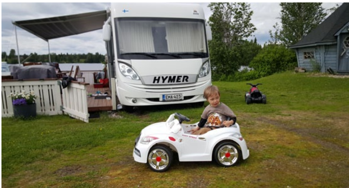
Lapsilla on mahdollisuus ajella sähköautolla tai mönkijällä.