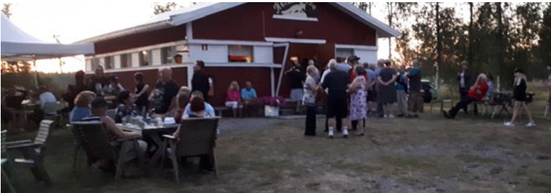
Lättärit 2018. Tanssikansa makkaran syönnissä Ässien tauon aikana.