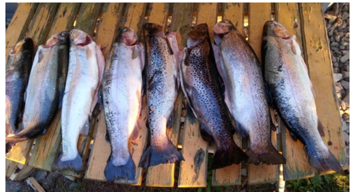
Ryynäsessä voit kalastaa. Yhden illan saalis Kemijoelta.