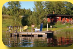
MAISANSALO www.maisansalo.fi . Tampere 300 sähköistettyä leirintäpaikkaa. Kuterintie 34, 34260 TERÄLAHTI (Teisko). Puh. 050 412 3123