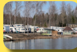
LEININRANTA www.sf-caravankaakkoishame.fi 85 sähköistettyä leiripaikkaa. Upeat Kymiöjen rantamaisemat ja hyvät kalastusmahdollisuudet. Siestantie 85, 47400 KAUSALA Puh. 040 8335 730