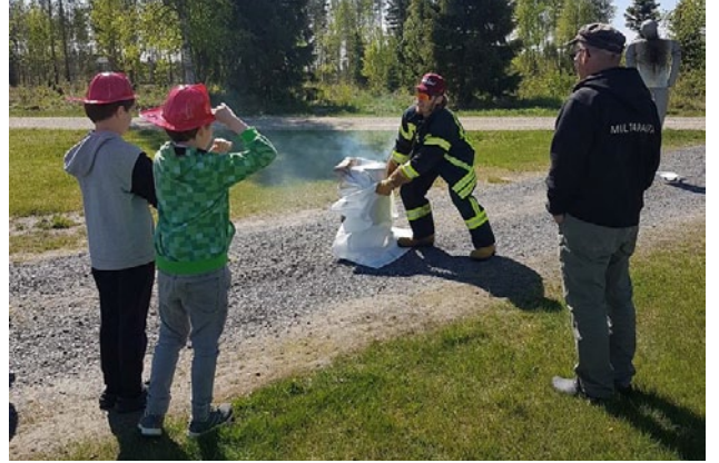
Kesäkauden avajaiset 2018. Myös lapset pääsivät harjoittelemaan tärkeitä sammutustaitoja.