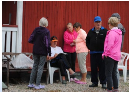
Lohenpainon arvaus tuottaa aina keskustelua.