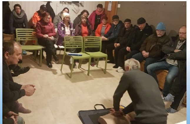
Deffa koulutus vuosi sitten keräsi paljon osallistujia. Onneksi laitetta ei ole tarvinnut kuitenkaan käyttää tositalanteessa.