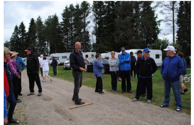
Kolikonheitto vaatii aina keskittymistä.