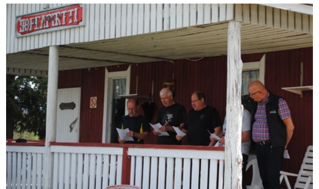
Siniristilippumme kajautettiin ilmoille elotreffien lipun nostossa.