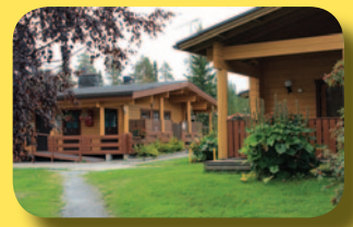
RANTASARKA www.sfc-oulu.com 164 sähköistettyä paikkaa, merenrantaan 100 m. Hyvät ulkoilumaastot alueen läheisyydessä. 25 km Oulun keskustasta pohjoiseen. Mustakarintie 46, 90810 KIVINIEMI. Puh. 050 494 3101