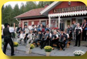
KRAPURANTA www.krapuranta.fi 250 leirintäpaikkaa, 200 sähköllä Korvenkulmantie 44, 32500 ORIPÄÄ Puh. 040 546 2058