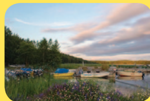
RAIRANTA www.rairanta.fi 270 sähköpaikkaa, kauniin merenlahden rannalla 7 km Uudestakaupungista etelään. Matala hiekkaranta, veneitä. Vanhakartanontie 216, 23500 Uusikaupunki Puh. 02 841 7400, 0500 825 899