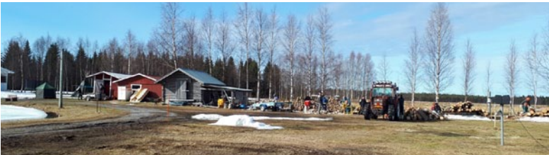
Vappu 2018. Ilmat alkoivat lämmentä ja saivat porukan joukolla puutalkoisiin. Yhdessä puut saatiinkin nopeasti tehtyä!