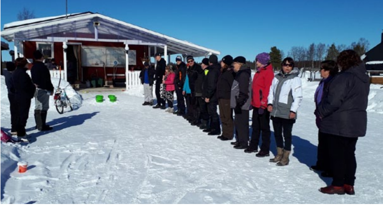
Pääsiäinen 2018. Upea ilma helli leikkimieliseen kilpailuun osallistujia.