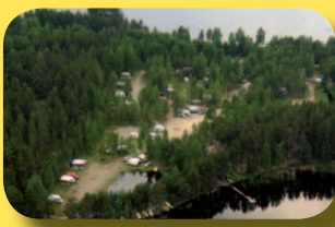
REKINIEMI www.pielisenkarjala.fi . Lieksassa Pielisen rannalla 100 sähköpaikkaa. Rauhallinen alue, hyvät kalastusmahdollisuudet. Rekiniemi 4, 81590 VUONISLAHTI Puh. 040 702 5745