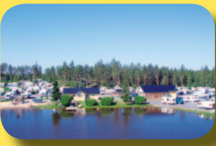
LUKKUHAKA www.lukkuhaka.fi Puhdasvetinen tekolampi, 165 leirintäpaikkaa, kaikki sähköllä. Korttesluomantie 148, 61550 ORISMALA. Puh. 040 090 5308