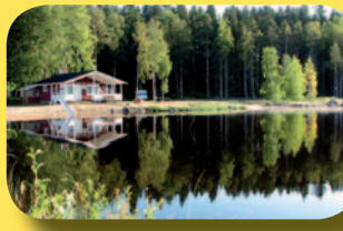
KUTURANTA www.kuturanta.fi Aarniometsässä kalaisan Lestijärven rannalla 200 leirintäpaikkaa, kaikki sähköllä. Ahontie 3, 69440 LESTIJÄRVI Puh. 040 756 7705