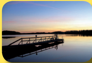
ETUNIEMI www.etuniemi.fi 145 leirintäpaikkaa, 135 sähköllä Etuniementie 148, 52550 HIRVENSALMI. Puh. 0400 465 876 Gps 61°40'367" 26°44'948"