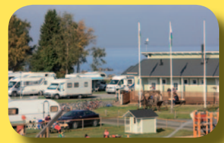
LOHENPYRSTÖ www.sfc-lohenpyrsto.fi , alue avattu 2011. Sähköistettyjä vaunupaikkoja 180. Alue meren rannalla Raahessa. Ilmainen wlan koko alueella. Lohenpyrstöntie 53, 92140 PATTIJOKI. Puh. 044 716 7803