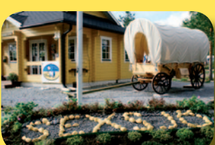
SEXSJÖ www.sexsjo.fi Rauhallinen, lapsiystävällinen, 120 leirintäpaikkaa, kaikki sähköllä Sandvikintie 111, 68940 LILLBY Puh. 050 310 1247