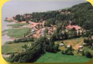
CAMPING MUSSALO www.sfc-mussalo.fi 120 leirintäpaikkaa, kaikki sähköllä Mussalontie 356, 23310 TAIVASSALO Puh. 040 764 9391