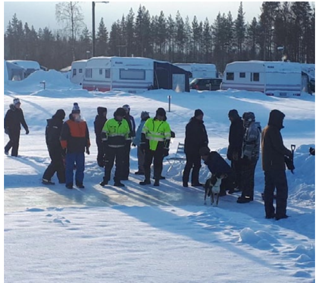
Laskiainen 2018. Perinteinen Curling-kisa alkamassa.