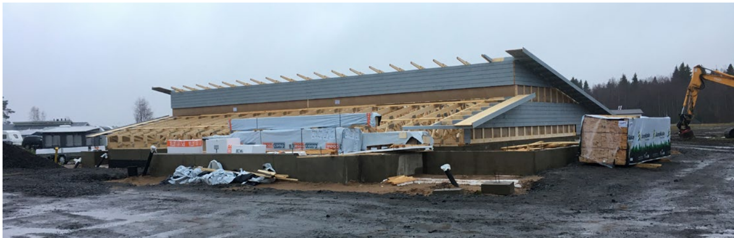
Rakentaminen alkoi ripeästi marraskuussa 2020.