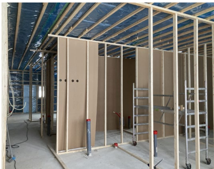
Lattiat valettu ja väliseinin pystytys alkoi helmikuussa 2021.