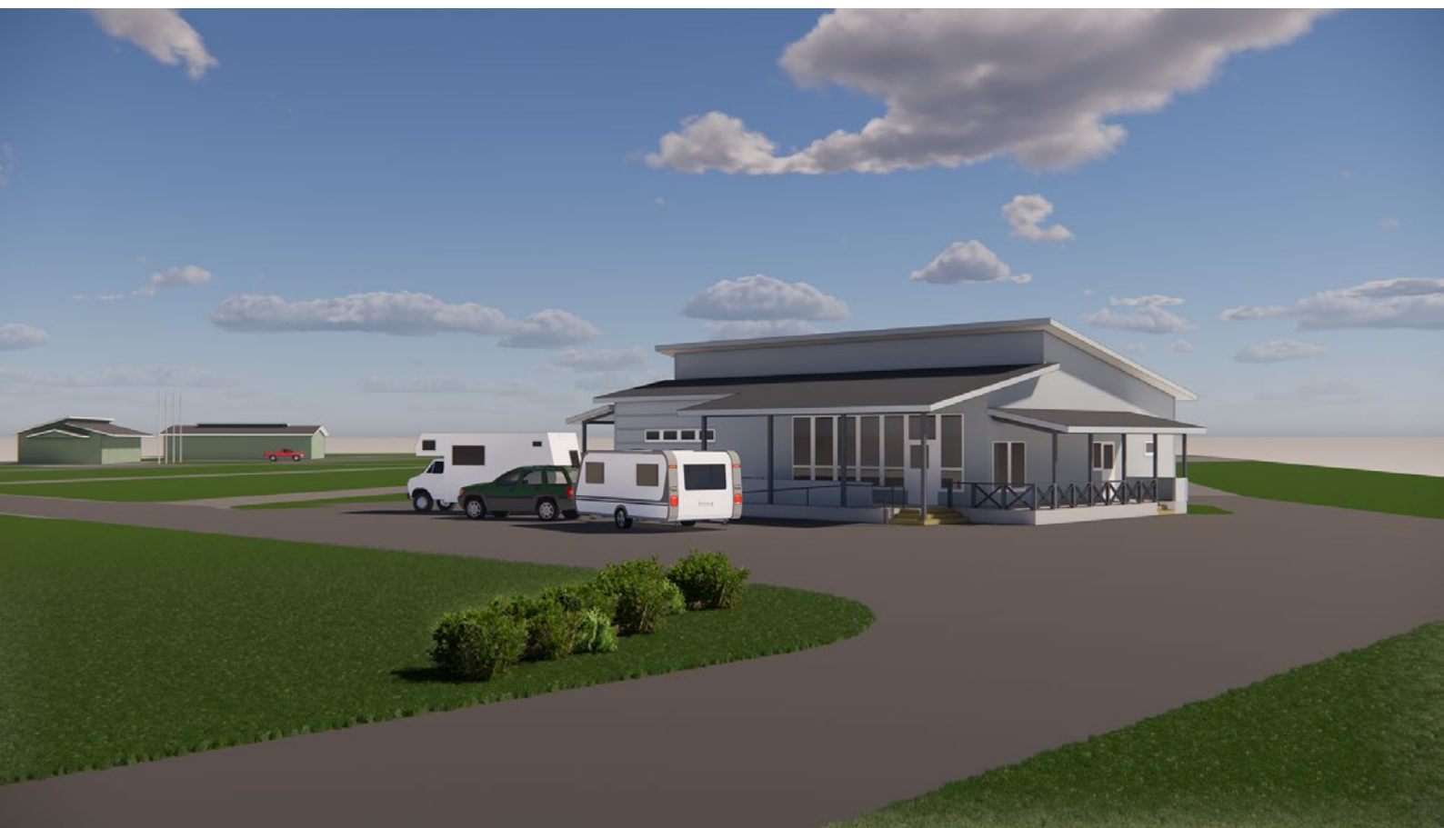
Luonnoskuva valmiista rakennuksesta.