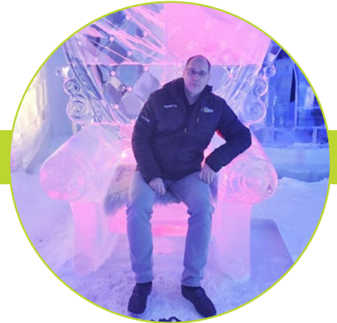
Puheenjohtaja mukana Raahen alueen matkailutyöryhmän opintomatalla Kemien lumilinnassa keväällä 2020 juuri ennen Korona-kriisiä.

Lohenpyrstössä kävimme pari vuotta sitten yhden viikonlopun ajan strategiatyötä alueemme kehittämiseksi. Pyrimme katsomaan aluetamme ulkopuolisin silmin. Valitettavan usein kuljemme omahyväiset lasit silmillä ja olemme liian tyytyväisiä omaan toimintaamme. Strategiatyössä halusimme ajatella mitä muut meissä näkevät. Samoin koitimme ajatella uusia kehittämiskohteita alueellamme. Olisiko löydettävissä uusia matkailijaryhmiä, jotka löytäisivät uudenlaiset palvelut meiltä Lohenpyrstöstä. Samalla on kuitenkin hyvä pitää mielessä myöskin se, että koko YT-alueen toimijat puhaltavat yhteen hiileen ja toiminta kullakin alueella pitäisi olla oman näköistä. Naapureiden toimintakopiot eivät välttämättä toimi omalla alueella. Kaikki eivät voi tehdä samaa, vaan kunkin on katseltava oma erikoistumisensa, kun pyritään etsimään uusia asiakasryhmiä.