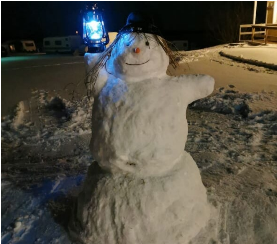
Hilla Helmikki Aurora.