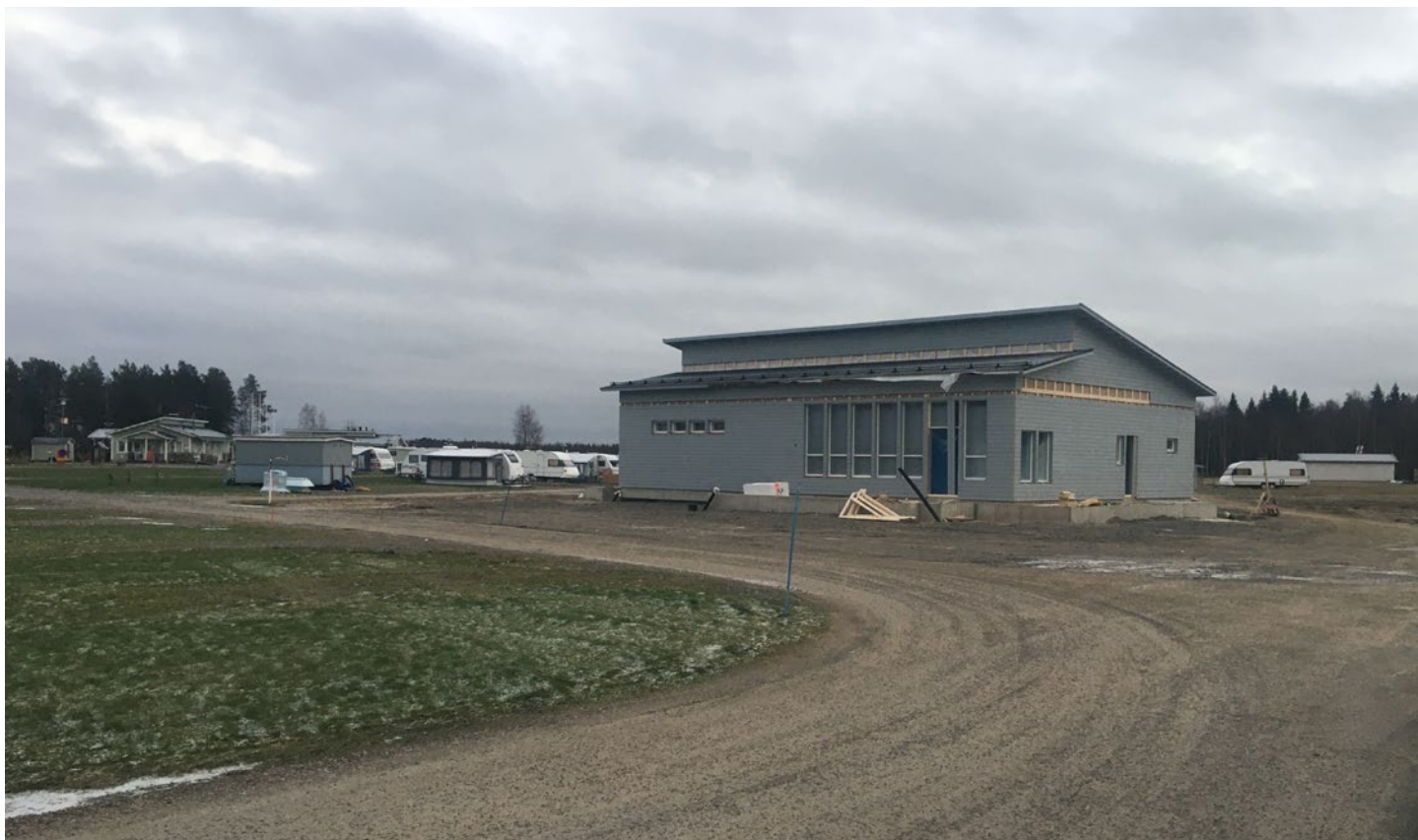
Väliaikainen lämmitys päällä joulukuussa 2020.