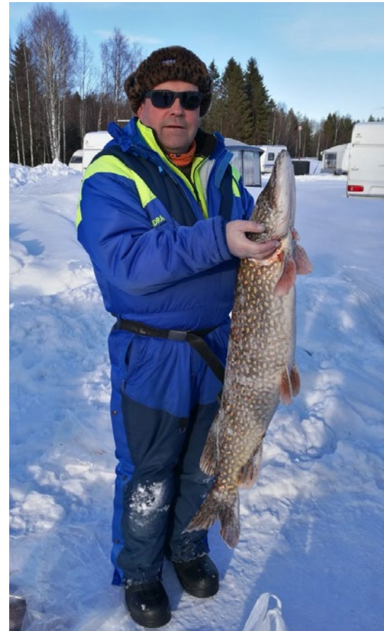
Suurin kala viime talvena oli 8.6 kg hauki.