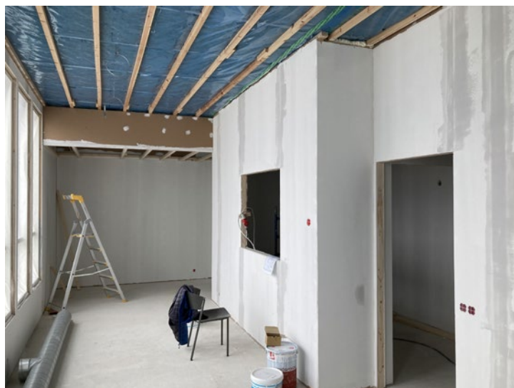
Uusi kahvio- ja oleskelutila muotoutumassa maaliskuussa 2021.