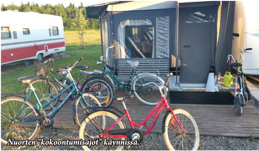
Nuorten "kokoontumisajot" käynnissä.