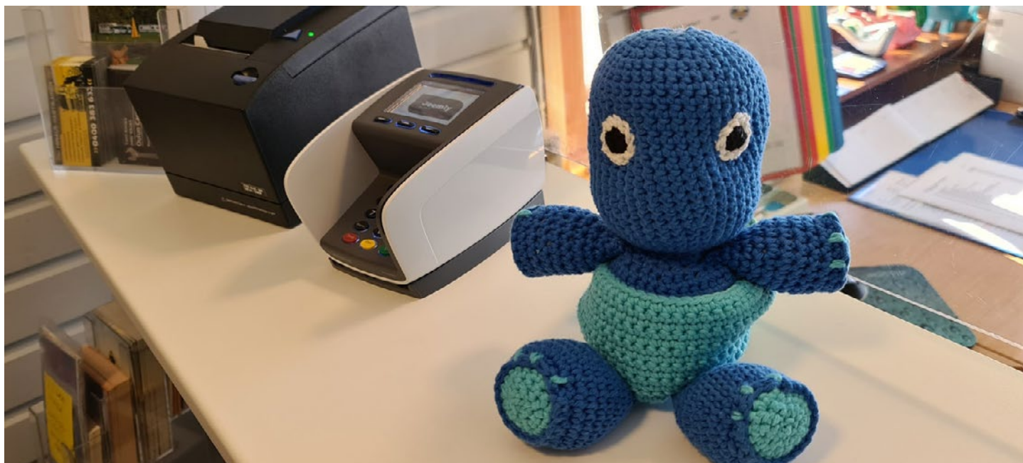
Virallinen SF-Caravan ry:n maskotti Maltti Matkaaja odottelee Rantasaran toimistolla jo innolla tulevaa kevättä, kesää ja vierailijoita!