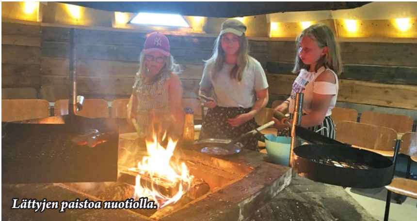
Lättyjen paistoa nuotiolla.